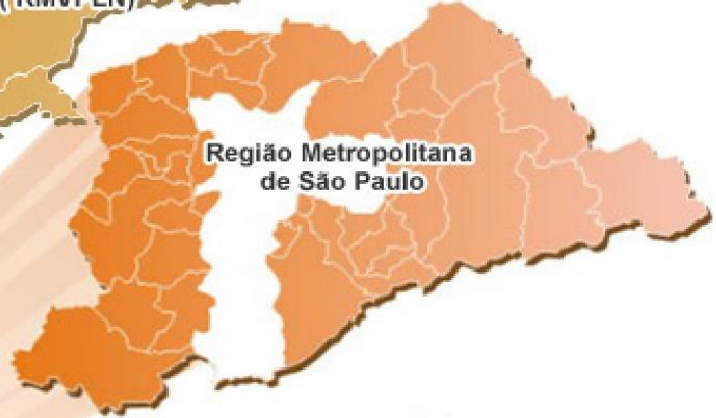
Região Metropolitana de São Paulo