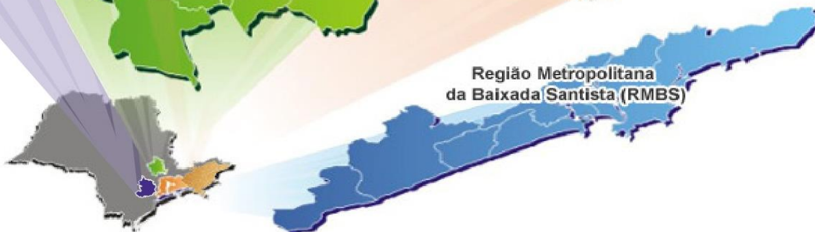
Região Metropolitana da Baixada Santista (RMBS)