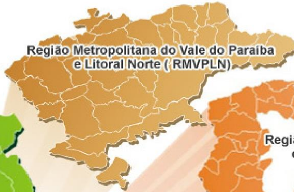
Região Metropolitana do Vale do Paraíba e Litoral Norte (RMVPLN)