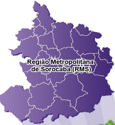
Região Metropolitana de Sorocaba (RMS)