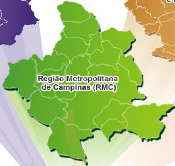
Região Metropolitana de Campinas (RMC)